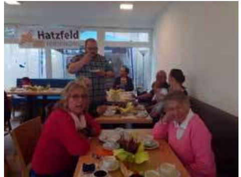
Einblick in den Gemeindefestpunkt während des Kaffeetrinkens.